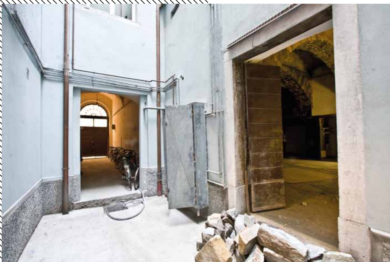
Corte Interna, Via Madonna del Mare 3a, Trieste