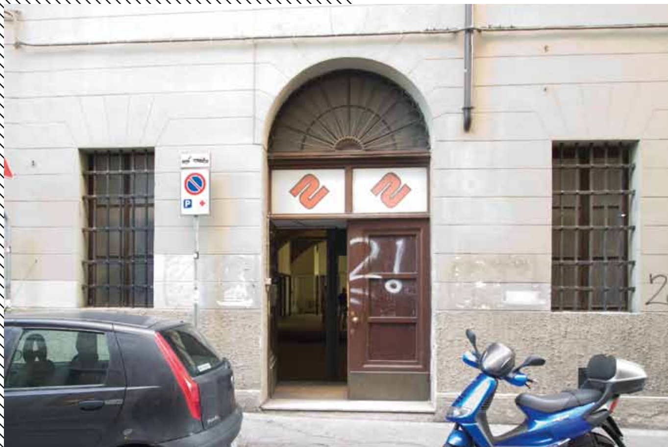
Ingresso, Via Madonna del Mare 3a, Trieste