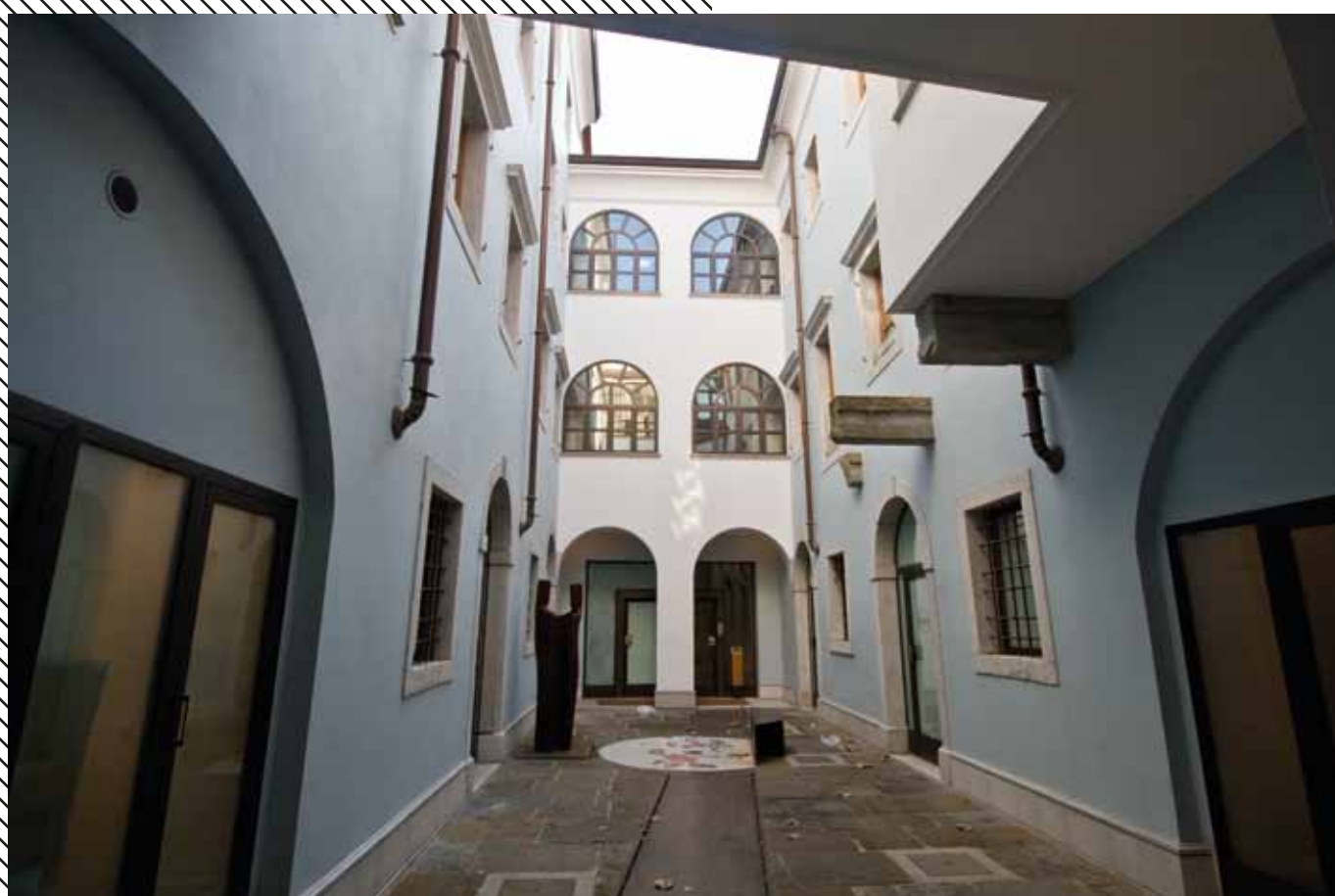
Ingresso, corte interna, via Cavana 14, Trieste