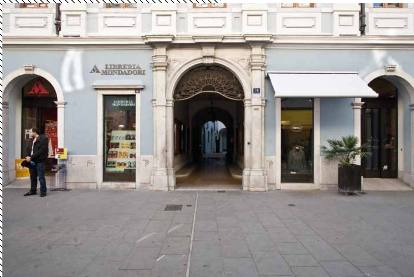
Ingresso, via Cavana 14, Trieste